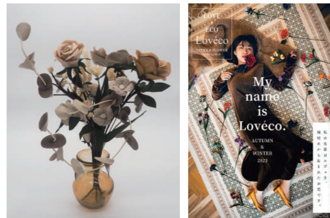
温もりのあるテキスタイルフラワー。アパレル業界のSDGsを知ってもらうきっかけになればと考えています。