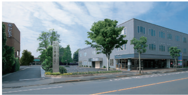
セレモア本社外観

セレモアグループは、家族葬・一般葬から4万人規模の社葬まで、圧倒的な実績を誇る葬祭業界のリーディングカンパニーです。私たちは葬儀の施行に留まらず、企業・団体の福利厚生として、葬儀・介護・相続などの特別優待を利用できる無料の法人会員制度を展開しています。さまざまなライフステージに