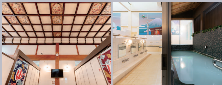
下町の銭湯らしくお湯は少し熱めの設定。出たあとも、ポカポカと心地よい余韻が続きます。