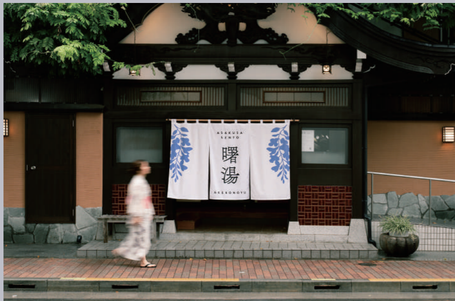
「文化を沸かす銭湯」として生まれ変わった曙湯。